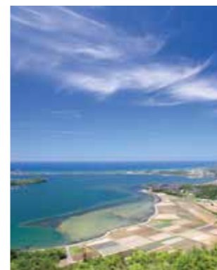
山陰海岸ジオパーク わたしたちはジオパークを応援しています!

丹後地域は京都府の最北端に位置し、北は日本海、西は兵庫県に接しています。海岸はリアス式で山陰海岸国立公園・若狭湾国立公園に指定され、美しい景色を楽しめます。古墳群もあり、丹後王国の存在など歴史ロマンに溢れています。 産業としては伝統的「丹後ちりめん」の他に、機械金属工業も盛んです。農業は、丹後コシヒカリや京たんご梨、ブドウ、桃、メロン等の他、京野菜の生産が盛んです。漁業は、春のマダイ、夏のトビウオ、秋のカレイ、冬のズワイガニ等四季を通じた魚介類の水揚げが行われています。また、久美浜湾のカキの養殖は、海水浴と共に丹後地域の観光資源になっています。